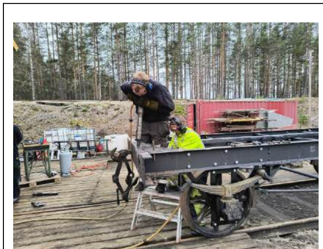
Klinking av rammen på L1 5118

Arbeid på L1 5118 har gått fremover i 2025. Dessverre har vi ikke gjort alt vi hadde håpet på da det ble påvist rustsprengning på knuteplatene som er naglet øverst på rammen. Her var det flere nagler som manglet og platene var meget dårlige. Det ble også montert midlertidige geider som ble reparert i 2021 og som sto klare for montering slik at vognen kunne settes på sporet. Dette arbeidet må gjøres mere presist når vognen løftes da disse må plasseres helt korrekt i forhold til akslingene før trafikk. Knuteplatene og gamle nagler ble fjernet og det ble laget nye plater med korrekte hull til nagler. De gamle hullene i rammen ble brosjert opp. Det ble påbegynt klinking av de nye knuteplatene med stoppet opp grunnet en arbeidsulykke. Vedkommende ble sendt til sykehus med forslått i bryst og hode. Dette resulterte i en lengre stans da det må lages støtte anordninger og sikres at slikt uhell ikke skjer igjen. Det ble gjort noen mindre arbeider til forberedelser til dette, men vi håper å få klinket i 2026.