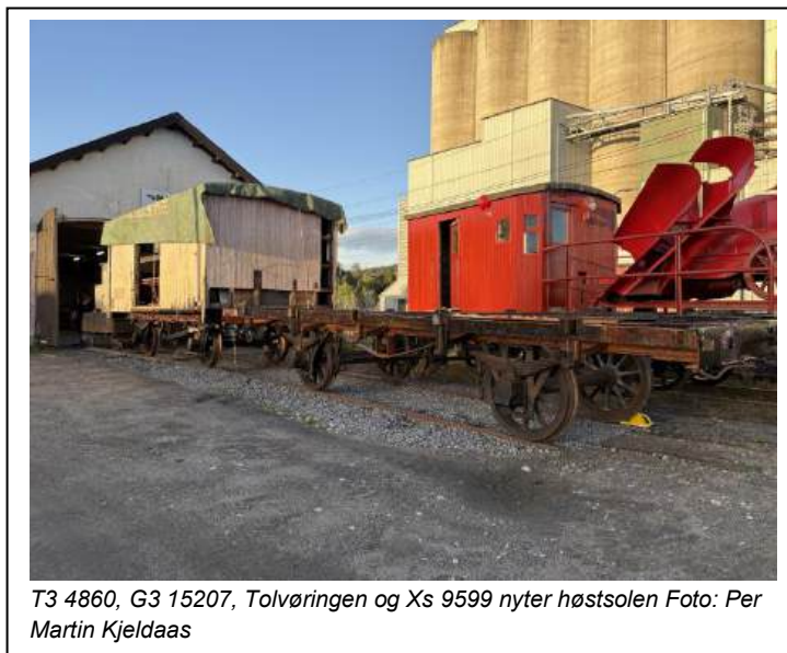
T3 4860, G3 15207, Tolvøringen og Xs 9599 nyter høstsolen

En av de viktigste aktivitetene i 2025 er at vi har lagt 22 meter med spor inn i den delen av lokstallen som har manglet spor siden NSB busser overtok hallen. Dette har gjort at vi får mere materiell under tak og større aktivitet. Vi har også startet med å isolere mellom loftet og hallen. Det er også lagt gulvbord slik at vi kan bruke loftet som lager fremover. Videre har vi ryddet mere og fått et mere effektivt verkstedsfasiliteter og sosiale aktiviteter.