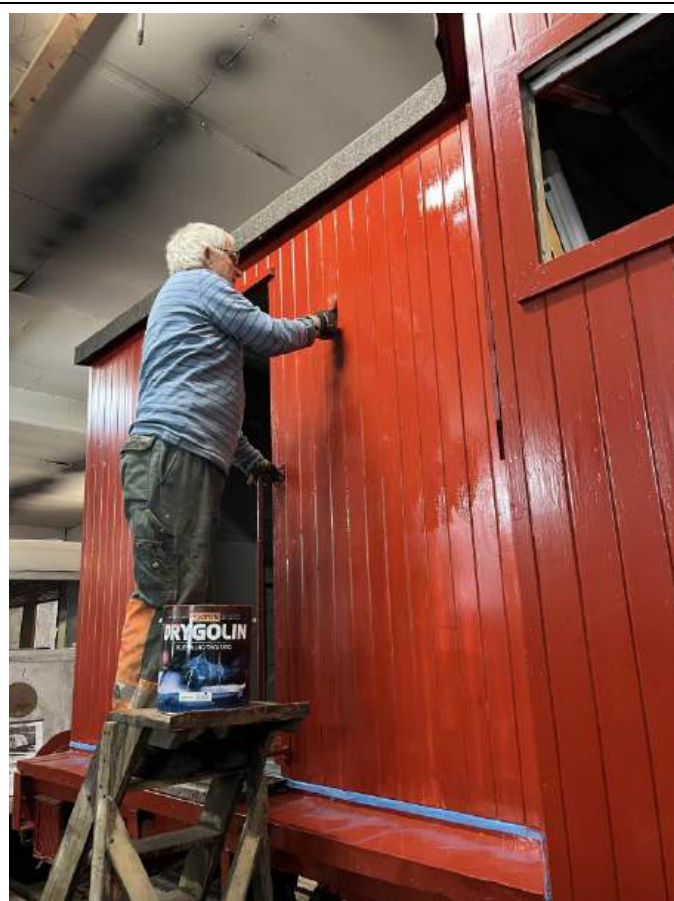
Per Kjeldaas maler siste strøket med rødt.

Sporrenseren er fortsatt under arbeid. Siste strøket med rødt er malt utvendig og første strøket med maling innvendig er utført. Dørene er ferdig panelt, montert og tilpasset. Det gjenstår å montere håndtak låskasser på dørene. Lyskasterne som lyser fremover når man ploger er restaurert og montert. Arbeidene med det tekniske for å få sporrenseren i drift er satt i gang. Det gjenstår også å maleferdig innvendig, male det siste på plogen og litt literering.