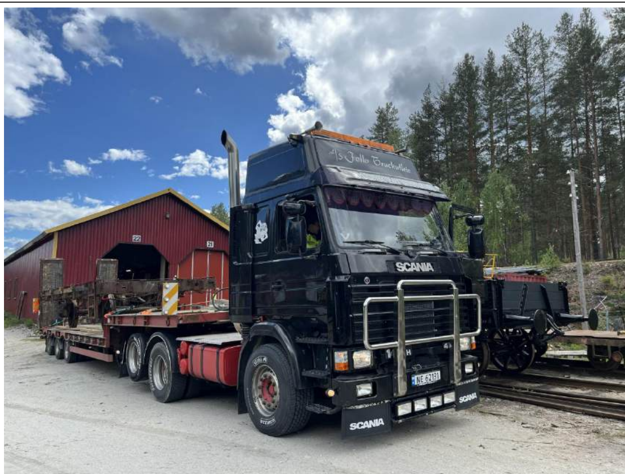
Follo truckutleie transportere vognen med rullende kulturminne fra Kløtiefoss til Mysen.

Ettersom L1 5118 ikke ble ferdig klinket og MK1 var ferdig restaurert ble det valgt å sende T3 4860 til Mysen. T3 4860 ble levert fra Strømmens Verksted til Smaalensbanen i den første serien T3-vogner fra 1913. Den har vært lagret på Kløtiefoss fra den ble utrangert fra Grorud verksted som hadde bygget et påbygg på denne til takmoduler. Dette ble fjernet og alt trevirke ble revet før vognen ble transportert fra Kløtiefoss til Mysen. Det ble stående utendørs en periode da sporet inn i hallen ikke var bygget. Det ble arbeidet på denne når været var pent. Før den kom inn ble det fjernet noe mere jern, pusset mye rust og grunnet på rammen. Når den kom inn i hallen ble den løftet slik at fjærer, hjul og geider kan repareres separat. Bremsbommen var også rustet fast og ble reparert igjen. De siste restene fra uoriginalt metall er blitt fjernet.