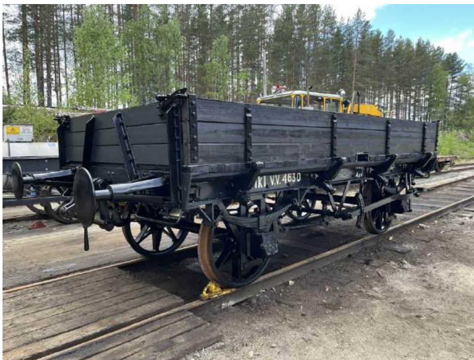
MK1 har akkurat ankommet Kløtiefoss..

MK1 ble ferdigstilt i år med tur på Krøderbanen. Toget besto av damplokomotiv Ulka (type 7a nr.11), MK1, Personvogn C3a nr.102 og Konduktørvogn CF nr.3552. Turen gikk fra Krøderen til Vikersund og tilbake med fotokjøring underveis og kryssing med et annet damptrukket chartertog på Sysle stasjon. Turen gikk den 31.05.25. På starten av året gikk det mye tid på å ferdigstille vognen med smøring av alle bevegelige deler, montere de siste delene, male siste strøket og male på påskrifter. Vognen ble transportert til Kløtiefoss den 28.05. Den ble da kontrollert og prøvekjørt den 30.05. Ved Snarum fikk den et lagerhavari som måtte utbedres på stedet. Takket være flinke, og stor dugnadsånd ble dette reparert raskt og turen 31.05. ble gjennomført. Vi vil takke for spesielt NJK Krøderbanen for et tett og godt samarbeid.