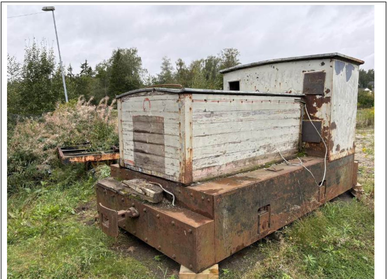
Tolvøringen slik de sto bak lokstallen på Mysen før den kom inn i lokstallen i høst.

«Tolvøringen» er bygget av AEG i 1909 til Saugbruksforeningen. I 1909 stilte arbeiderne på Saugbrug et lønnskrav på tolv øre. Tolv øre fikk dem ikke. I stedet dukket det opp et lokomotiv som da fikk økenavnet "tolvøringen". Det er et elektrisk lokomotiv som går på batteri altså et akkumulatorlokomotiv. Det har 2 motorer på 8hk., kraftbehov er på 85V. 60amp., 300 ktW og det veier ca. 6 tonn. Lokomotivet ble brukt i Halden hos Saugbruksforeningen til å transportere vogner fra høvleriet til havnen og til jernbanestasjonen. Den har en sporvidde på 1435mm. (normalspor). Lokomotivet ble gitt fra Norsk Skog til Halden historiske Samlinger en gang på 1990-tallet. Det ble videre gitt til Norsk Jernbaneklubb i 2023. Det eies i dag av Stiftelsen Norsk Jernbanearv. Denne har stått ute siden den ble gitt av Saugbruks til i høst da den kom inn i lokstallen. Det er påbegynt restaurering av den og arbeidet vil ta tid.