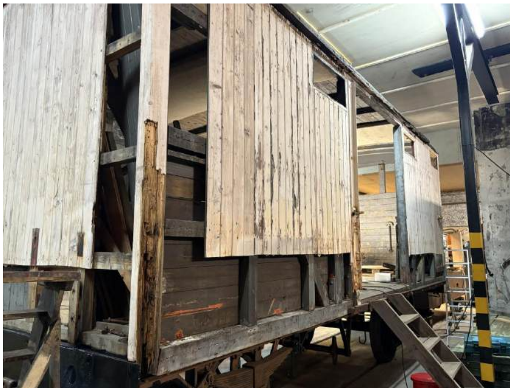
G3 15207 i lokstallen Mysen November 2025

G3 15207 har fått en grundig kartlegging av skader og råte. Det er en skade fra et skifteuhell på Kongsvinger stasjon i NSB tiden som er større enn antatt. Denne skaden er så stor at det må skiftes mere av stenderverket enn antatt og planlagt. Skadene er så store at dette prosjektet trenger vesentlig mere tid på å ferdigstilles enn planlagt og mere resurser. Dette er noe vi har igangsatt planlegging på nå og NJK Godsvogn avd. er forberedt på å gjøre vognen ferdig. Vi har målt vognkassen og denne var meget skjev, og det ble gjort et forsøk på å rette den. Forsøket hjalp litt, men ikke nok til at den er rett nok til å settes i stand. Dører ble da demontert og skal bygges nye da dem er råtne og skjeve. Det er råteskader der skinnene til dørene er, og alle dørkarmer er knekt og skjeve så disse må også byttes. Dette er bl.a. en del av bærende konstruksjoner av vognen. Det er begynt med reparasjoner av reisverket på den ene kortveggen. Det er også fjernet det meste av takpappen og takkonstruksjonen må måles mere på når vognen er rettet da det er mistanke om svikt i bærende konstruksjoner i taket. Enkelte takbord er råtne og listverket rundt taket er råtne. Det er skrappt, pusset og grunnet en del på rammen. Det ble oppdaget da noen sprekker i rammen samt rustskader som må utbedres. Det er demontert store deler av bremsestell og drag stell. Bremsesettet må revideres og enkelte deler må erstattes med nye. Hesteputene inni vognen er erstattet med nye og montert.