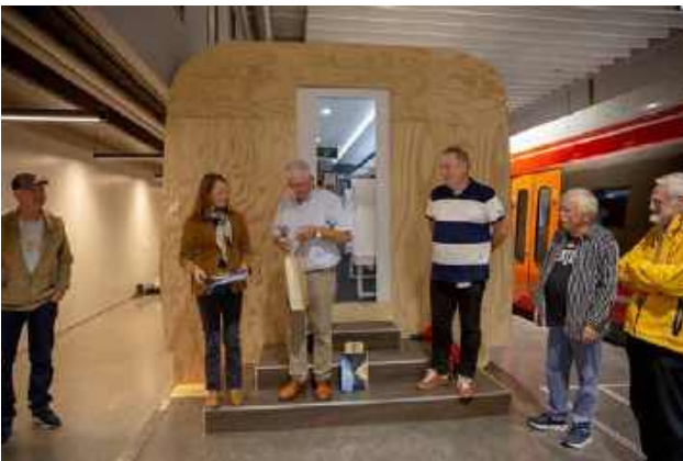
Vi takket for oss med noe håndfast til de to som tok oss imot og sørget for at vi ble godt ivaretatt.