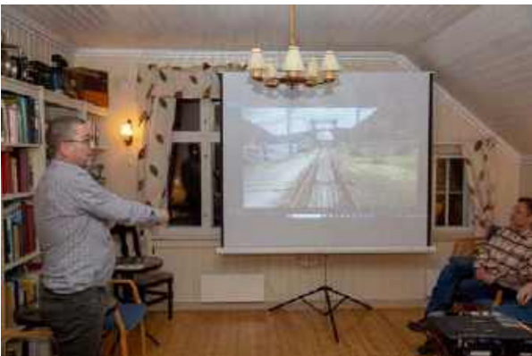
... blant annet til Rjukanbanen og fergeleiet på Mæl stasjon, hvor MF Storegutt ligger fortøyd.