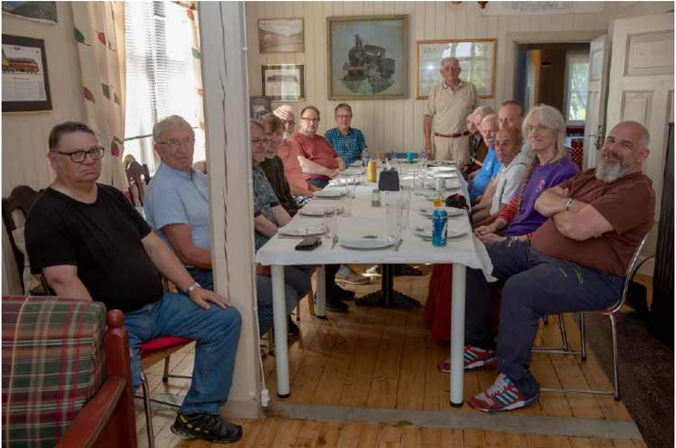
Som året før var været godt, så nært som en hissig regnbyge mens maten ble tilberedt. Heldigvis var teltet reist over grillene. Luften var langt skarpere enn det som gjør det trivelig å sitte ute og spise, derfor ble det dekket på i salen i andre etasje.