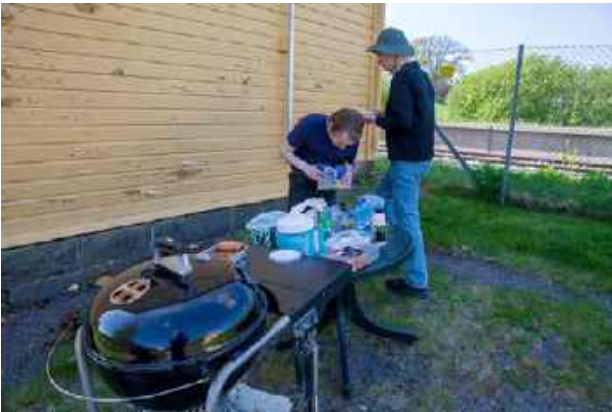
Ingen dugnad uten dugnadsmat! Og når man disponerer en Weber Performer kulegrill ligger alt til rette for god mat, ...