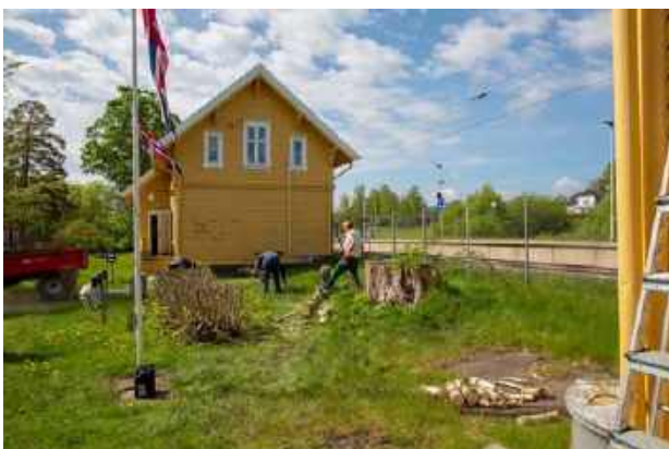
Vårdugnad 10. mai, Ståle har felt den døde bjørken som sto mellom stasjonsbygningen og godshuset.