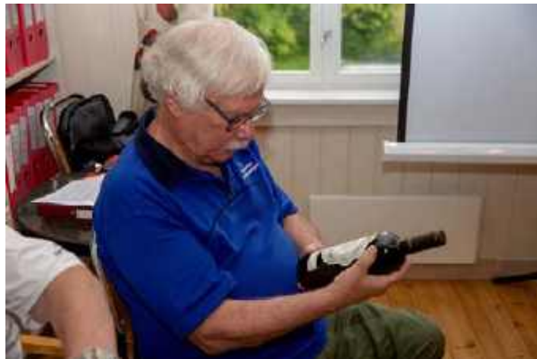
... Skoppum til Horten. Den velfortjente takken ble studert inngående, konklusjonen var at det var et godt valg.