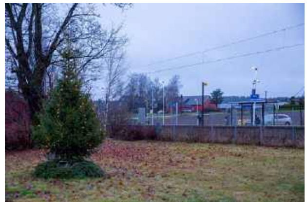
Selv om det fra naturens side var lite som minnet julestemning, er det flott med en julegran synlig for togreisende og naboer.