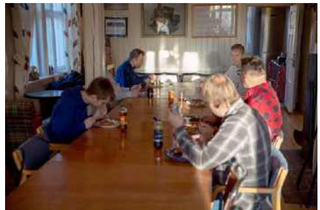
Det er godt å kunne samles rundt bordet til et varmt måltid når man jobber dugnad.