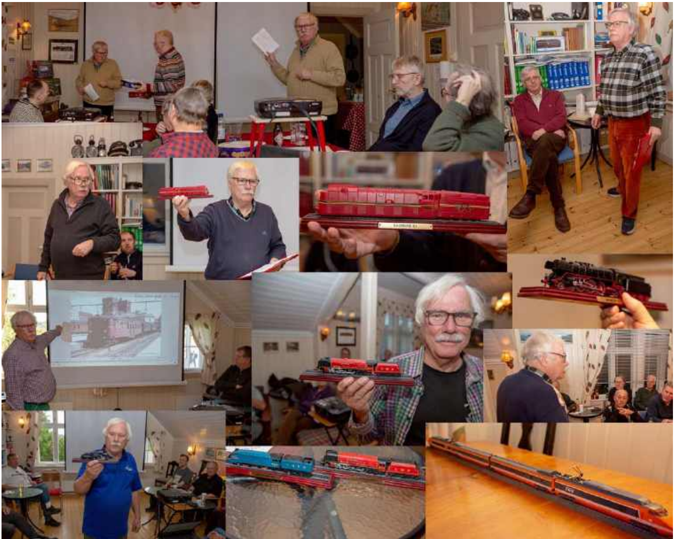
Kjells hjørne har inneholdt mange godbiter, fra amerikansk lok for enkle skogsbaner til fransk første generasjon TGV høyhastighetstog.