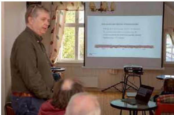
... gang kommer, blant annet erstatte 69-settene som har fraktet reisende siden 1970.