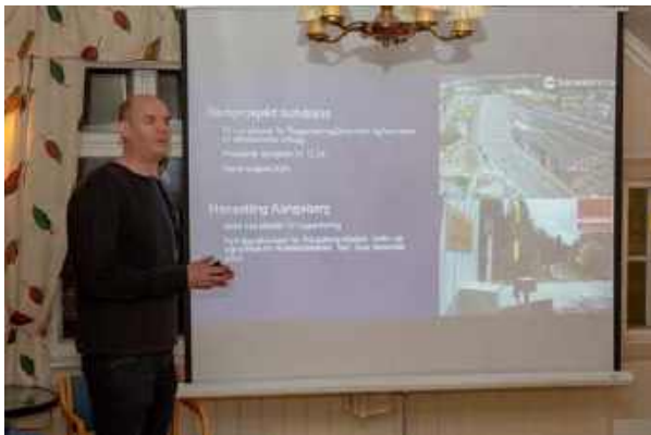
... moderniseringen, med særlig fokus på Stokke-Sandefjord. Men det var også andre prosjekter som ble omtalt.