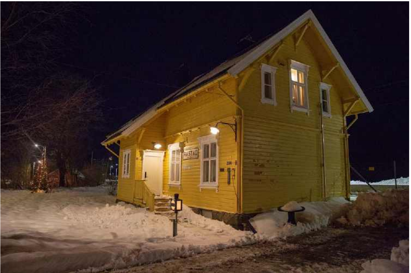
Kveldsstemming 8. januar, et hvitt teppe har lagt seg over stasjonshagen. Julegranen lyser opp i vintermørket.