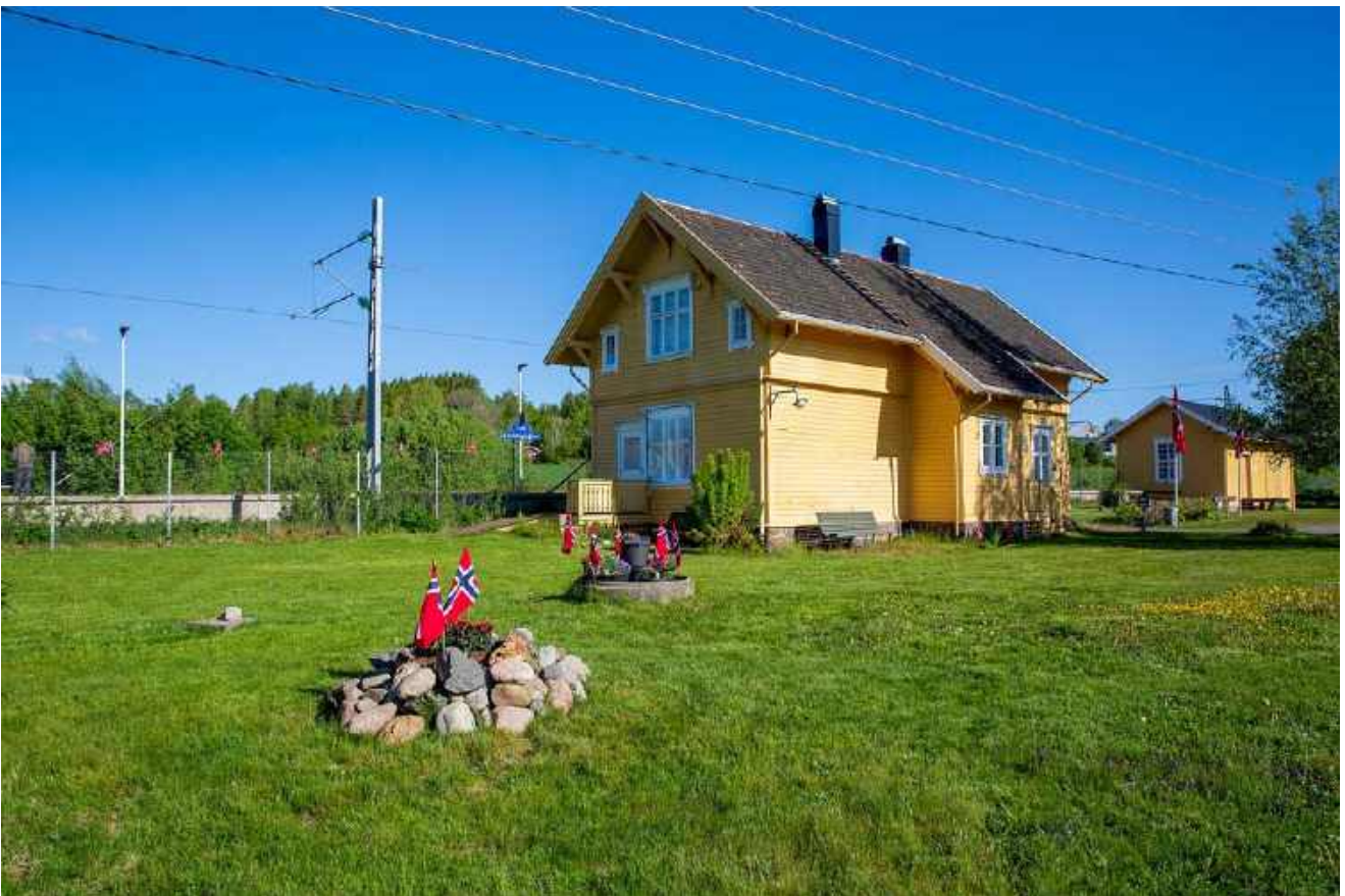
17. mai, flaggene er heist, blomsterbed og gjerder er pyntet med flagg, plenen er nyfrisert.