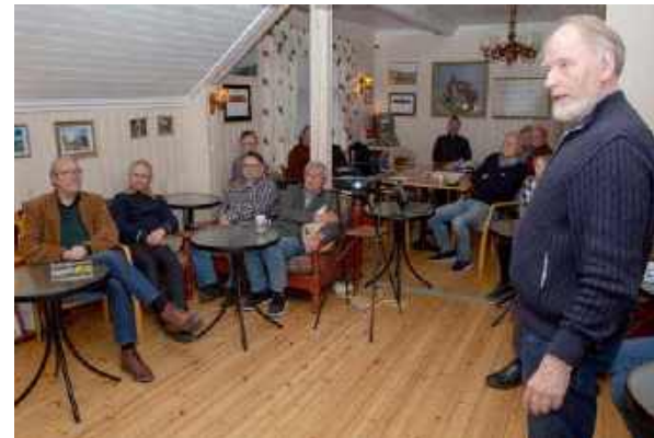
... både små og store. Det kom mange gode tips, og publikum fikk innblikk i flere geniale løsninger på verktøyfronten.