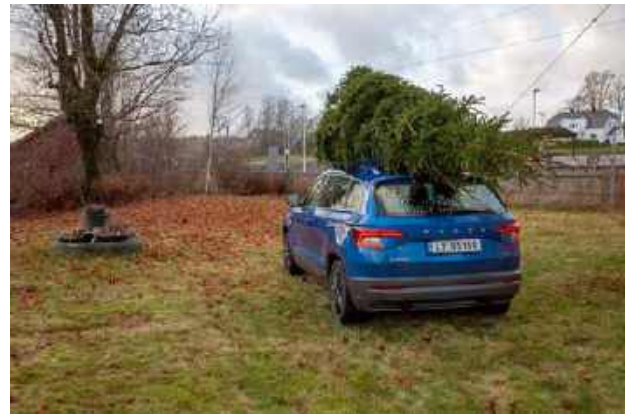
Transporten av julegranen til stasjonshagen ble besørget av Rolf Burud 28. november, her er ekvipasjen fremme.