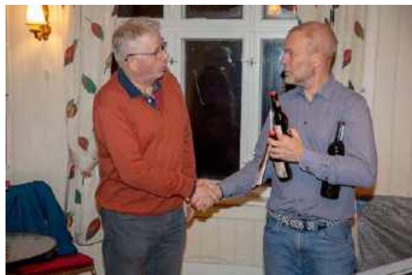
... godt drikke til foredragsholderen, som ikke utelukket muligheten for nytt besøk.