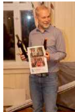
Dialogen med tilhørerne var som alltid god, og det var mange og gode spørsmål underveis. Det vanket både lesestoff og ...