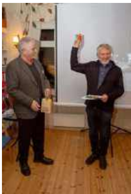
Lykken er en Kvikk Lunch ved vel gjennomført bildeforedrag, ytterligere forbedret med godt øl fra det lokale bryggeriet.