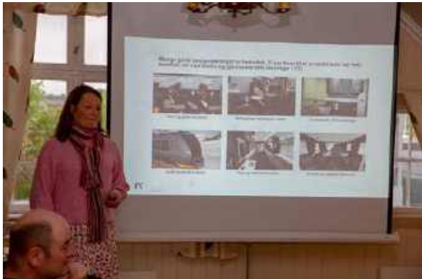
... forrige besøk. Ikke nok med at det ble gitt god informasjon der og da, hun toppet med invitasjon til å se en mockup av toget.