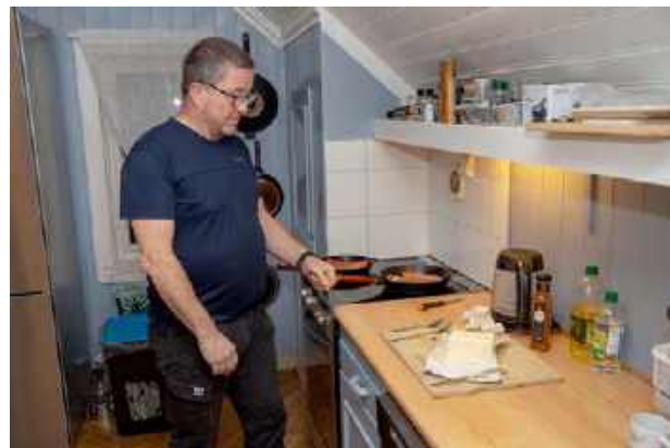
Milan tok kjøkkentjenesten 12. november og bød på spesialpølser, servert med potetsalat og råkostsalat.