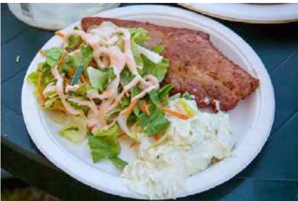
... som velsmakende grillribbe servert med potetsalat og frisk salat.