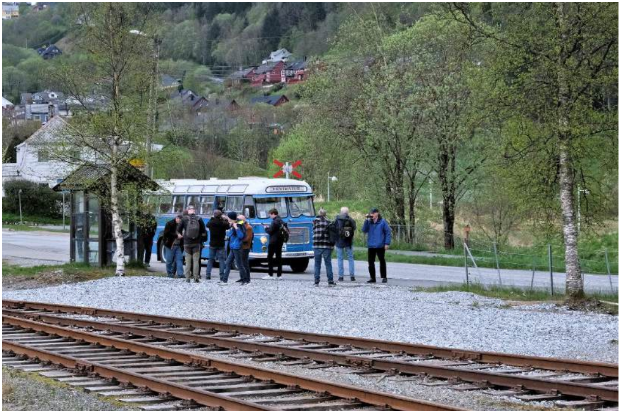
Den ene av to veteranbusser har ankommet Arna.