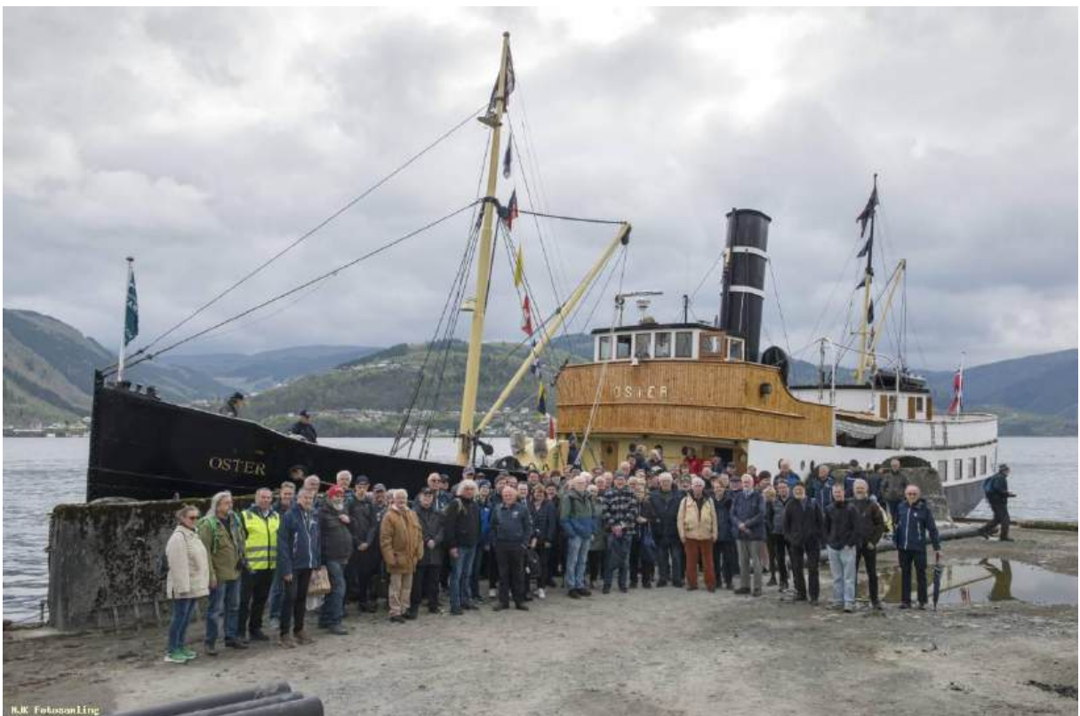
«Familiebilde» tatt før avgang fra Garnes.