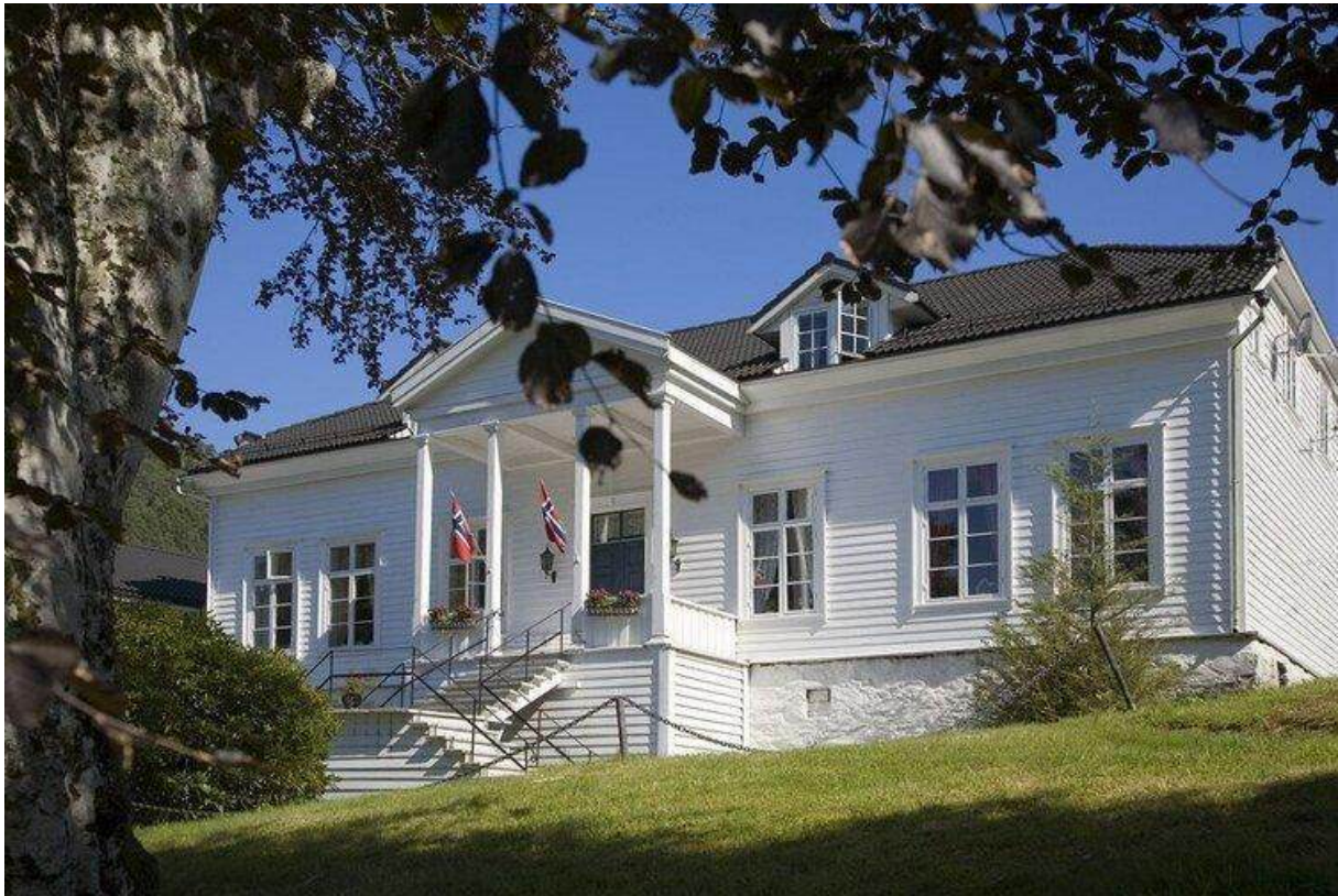
FjordSlottet hotell på Osterøy, Nord-Europas største innlandsøy.

Søndag 27. april arrangerte NJK Reiser medlemstur til NJKs årsmøte som ble holdt på FjordSlottet hotell på Osterøy. Det startet med veteranbusser fra Bergen sentrum til Gamle Vossebanens stasjon på Arna, hvor veterantoget med motorvognene BM 86.68 og 86.60 stod og ventet. Turen gikk fra Arna via Garnes til Tunestveit, og tilbake til Garnes. Videre var det en to timer lang tur med veteranbåt fra Garnes til Osterøy.