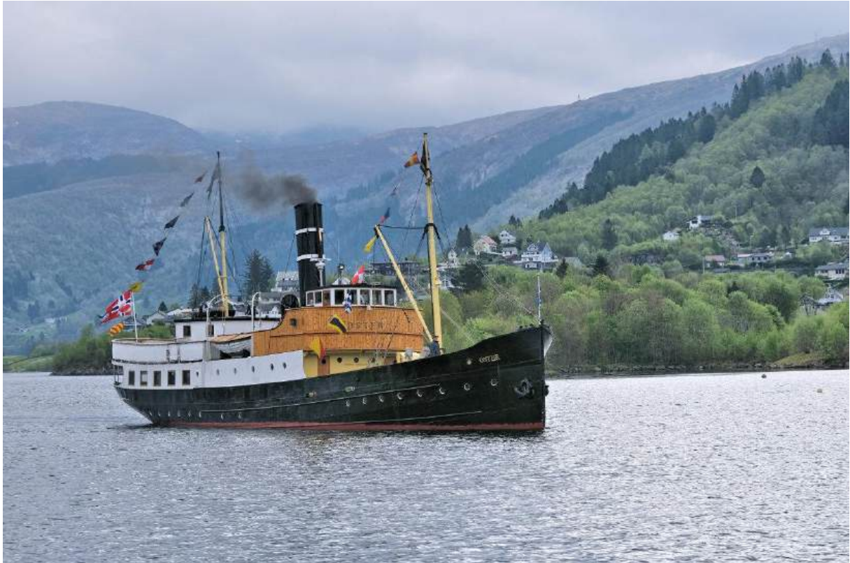
D/S "Oster" på vei inn mot brygga.