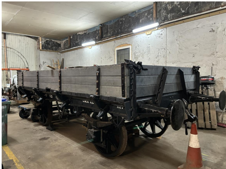
MK1 inne i lokstallen Mysen den 15.11.24..