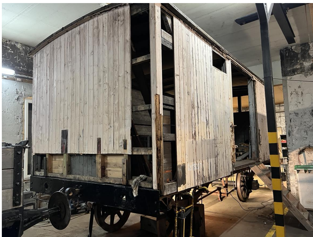
G3 15207 i lokstallen Mysen desember 2024

G3 15207 fikk vi ikke prosjektmidler til i år, noe som resulterte i at vi ikke fikk gjort alt vi hadde tenkt til å gjøre. Det har blitt konstatert den del råte i reisverket og at vognen har hatt en stor kollisjonsskade. Arbeidet er startet med å fjerne råttent stenderverk med bunnsvilla og å rette ut bufferbjelken i den ene enden. Det er pusset en del rust i understellet og bremsedeler er begynt demontert. Dette måtte repareres og oppgraderes, da det er blitt påført store rust angrep. Takpappen på taket er nesten ferdig fjernet og på undertaket er det påvist råte.