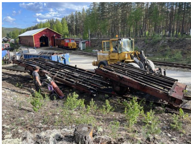
Restene av Gbs 21 76 150 0201-1 på Kløftefoss.

Denne kom fra Gamle Vossebanen i 2021 og ble i år hugget. Vognen var overflødig, og for å gi moderne godsvogner og godsvognene som står på verneplanen ulike deler og en lenger, bedre brukstid blir delene fra vognen gjenbrukt til dette. Denne ble hugget på Kløftefoss og det gjenstår noe arbeid med å demontere deler. Endene fra rammen er tatt vare på, da det ikke var nok tid i år til å bli ferdig med huggingen. Det gjenstår også å få delene under tak.