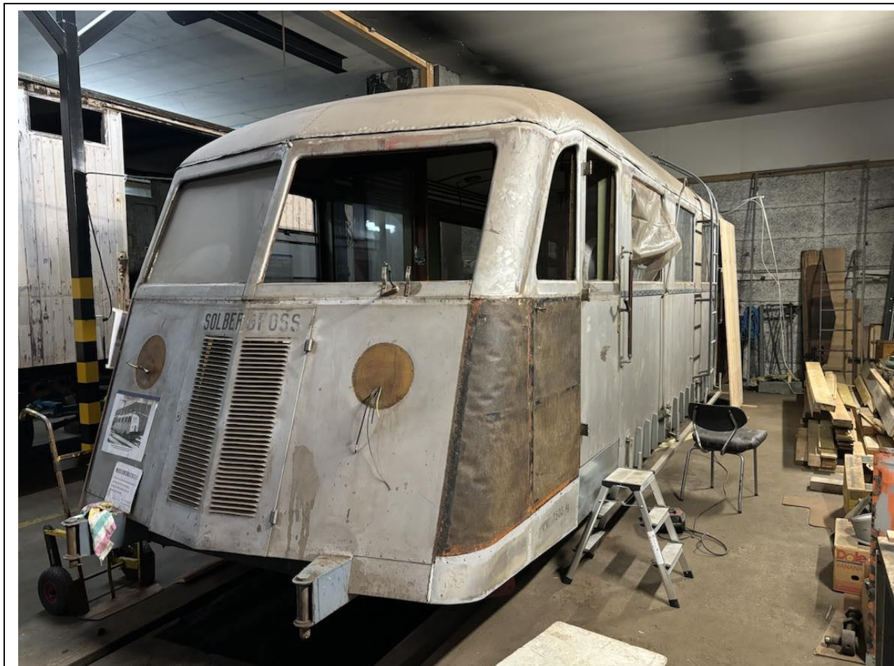
Padda inne i lokstallen på Mysen den 15.11.24.

Arbeidene på Padda har gått fremover i 2024. Det er startet arbeidet med å se over råte og skader på treverket bak metallplatene. Det ble oppdaget en skade nederste eikerammen i det ene hjørnet. Dette resulterte i en del arbeider med å finne tettvekst Eik og få felt inn en ny bit inn i det eksisterende runde hjørnet. Det ble også skiftet plate under bakhjørnet på høyre side da denne var rustet helt opp med årene. Det er også gjort en del med å trekke og merke kabler til styrevogns plassen. Dette arbeidet fortsettes ut året og neste år. Det er mye som må trekkes nytt og merkes av kabler. Lampene bak på Padda er demontert, skal settes i stand, og det er trukket nye kabler til disse. Plogen til vognen er sendt til reparasjon og sandblåsing. Så dette arbeidet har ikke blitt fulgt opp, da det har vært mye aktivitet med selve vognen.