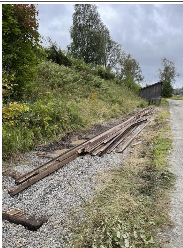
Restene av spor 4 på Kråkstad 2024

Vi har hjulpet Østfoldbaneavdelingen med bistand med å skaffe dem en endebutt og vi har revet spor 4 på Kråkstad stasjon. Vi ryddet opp og transportert alle skinner med deler til Mysen, der vi har bygd 30 meter med spor foran lokstallen på Mysen. Vi har hatt erfaringsutveksling med Setesdalsbanen, i lokstallen på Mysen, der dem var svært interessert i hvordan vi har pusset opp Sporrenseren. Vi har også vært med å arrangere Modelljernbanemesse i lokstallen på Mysen og vi har arrangert Julemøte i samarbeid med NJK Østfoldbanen i Mysen.