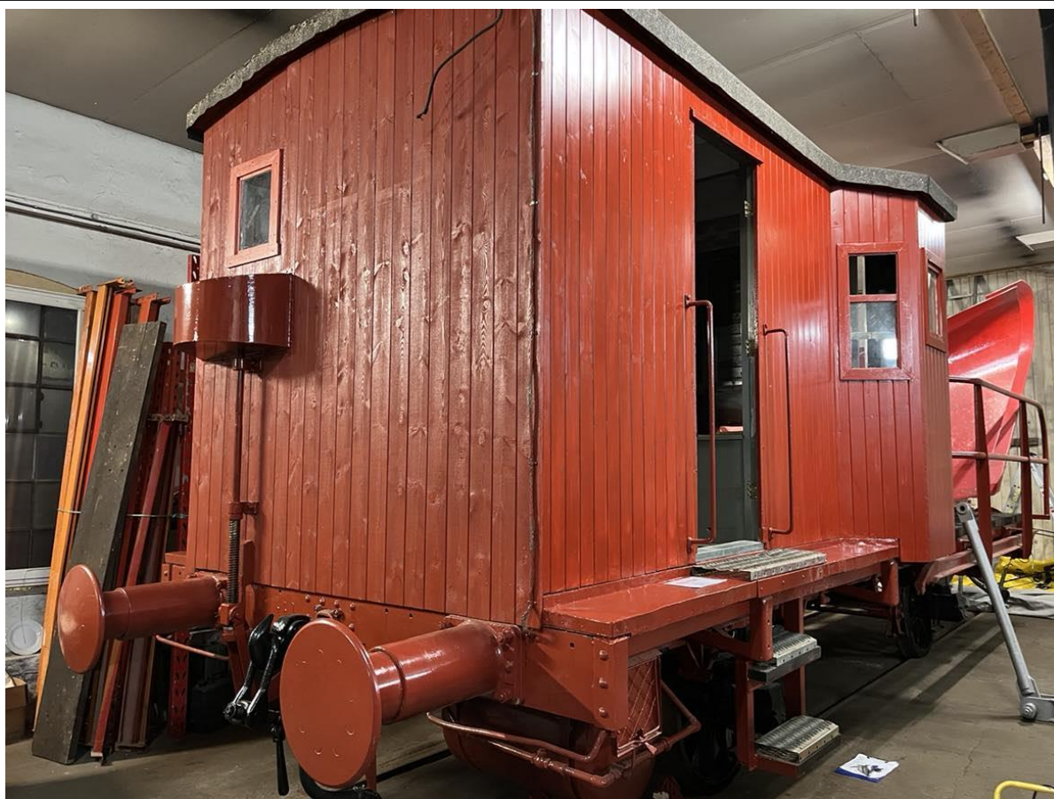
Sporrenseren desember 2024