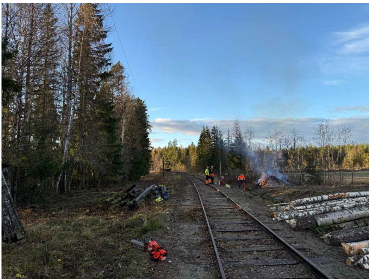
Mye kratt og skog ble ryddet ved innkjør Sysle.

Totalt ble det lagt ned 383 timer mot 531 arbeidstimer i fjor.