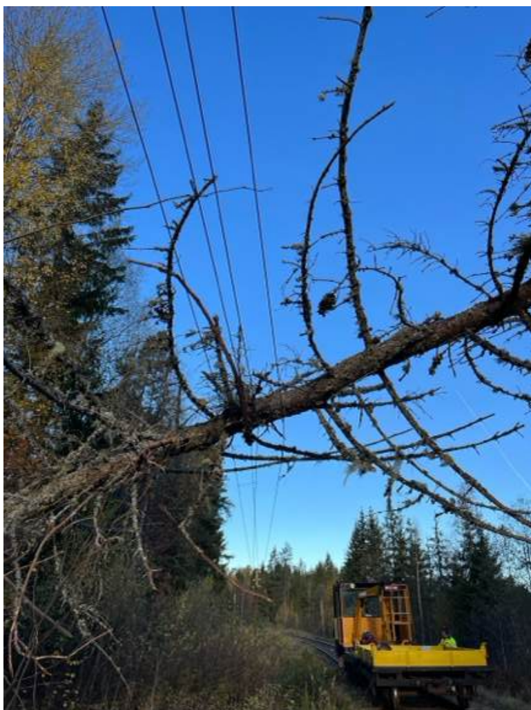
Vær og gamle trær sliter på telegraf og mannskap, her Sysle.

Den midlertidige kabelen mellom km 96,1 og 96 benyttes fortsatt i påvente av permanent kabelgrøft. På slutten av året ble telefon- og telegraforbindelsen ved km 117 brutt i forbindelse med Loe sitt arbeid med undergang fram til nytt næringsområde.