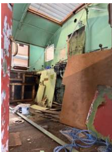
Førerhuset ribbes innvendig før oppbygging.