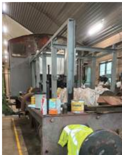
Ett skall står igjen mens man jobber med motor.