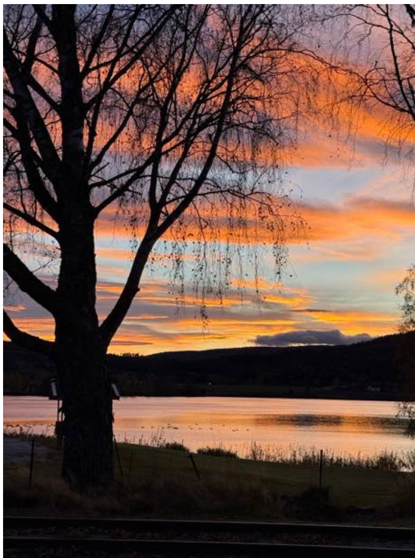
Utsikt fra Krøderen stasjon 11. oktober 2025.

Det har kommet noen nye aktiv i år som har deltatt på flere dugnader og i sesongen. Er du interessert i å bli aktiv på Krøderbanen, ta gjerne kontakt på frivillig.kroderbanen@njk.no .