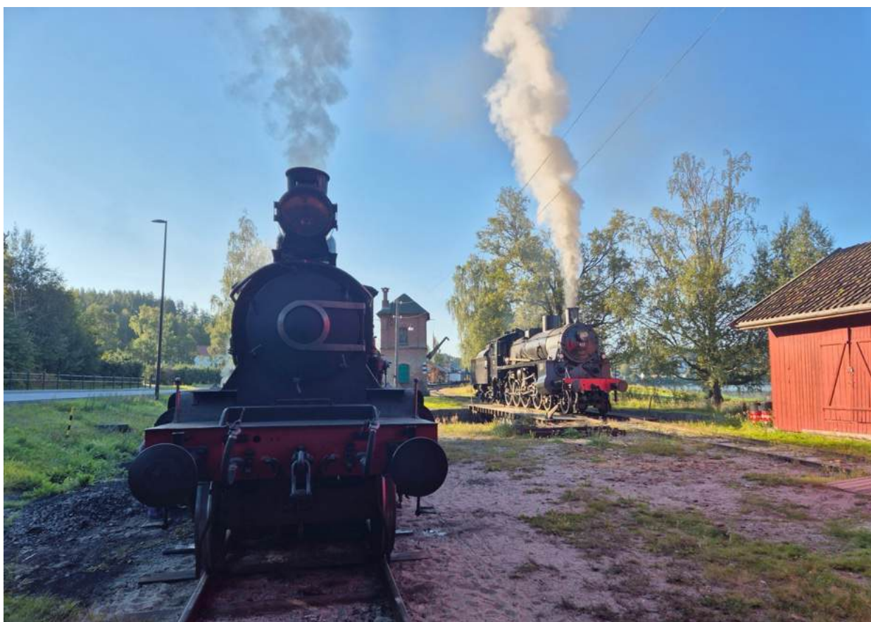
21b 225 og 26c 411 foran lokstallen på Krøderen.

Krøderbanen er en 26 km lang museumsjernbane mellom Vikersund og Krøderen i Buskerud. Virksomheten drives av Norsk Jernbaneklubb – Krøderbanen (NJK) og av Buskerudmuseene avd. Krøderbanen (BM).