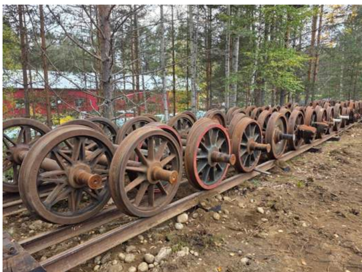
I høst ble det bygd nytt flettespor ved siden av store vognhall slik at man kunne flytte og samle hjulsatser i forbindelse med klargjøring av tomt for ny lokstall.

Medgått tid er fortløpende rapportert til Buskerudmusene.