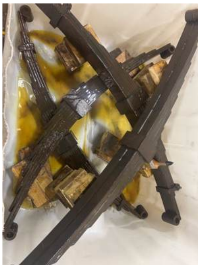
Fjærer til CF 3552 har badet i olje gjennom vinteren.