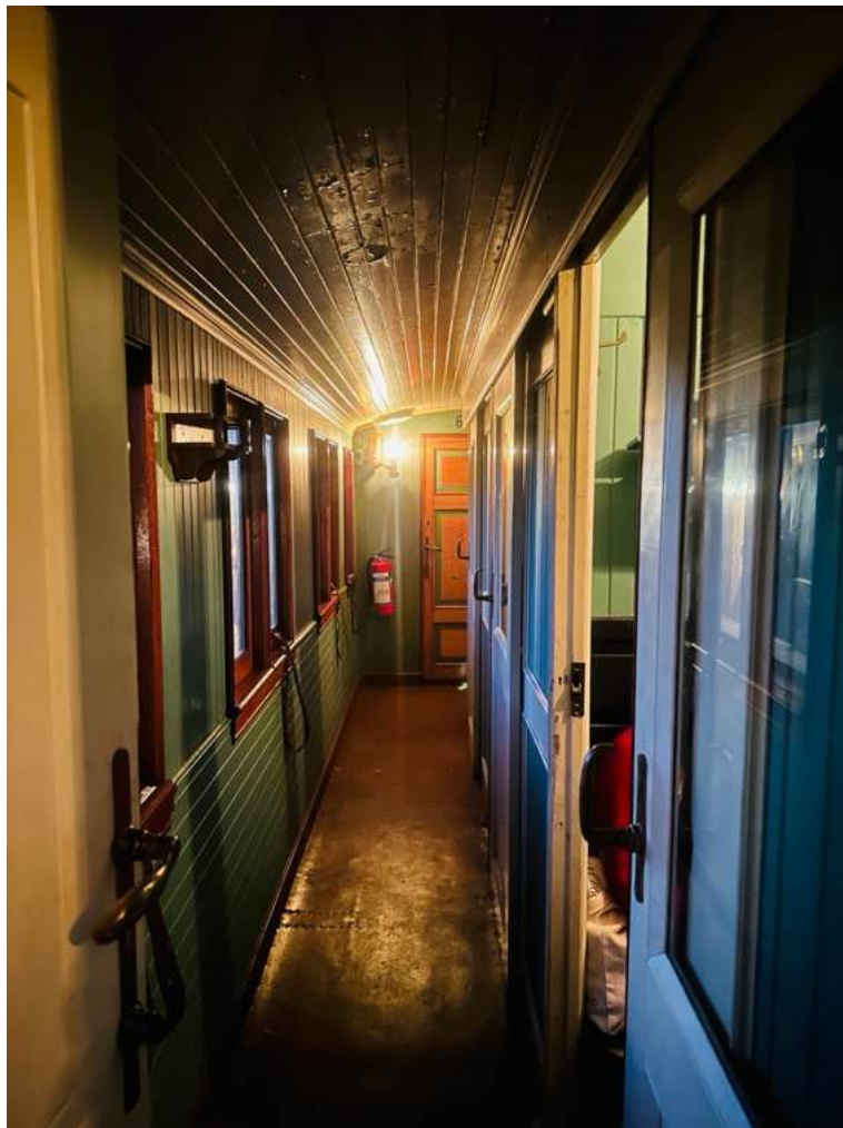
Stemningen fra parafinbelysning på skumringstogene er noe for seg selv.

Det har blitt holdt jevnlig vedlikehold av kupélampene og nødlampene som Krøderbanen bruker. De virker uten større problemer. Test-jiggen som har blitt bygget tidligere forenkler vedlikeholdet. Vi har nok driftsklare nødlamper til skumringstogene/ juletogene, og har også driftsklare i reserve. Det er ikke utført noe merking av lampene i år.