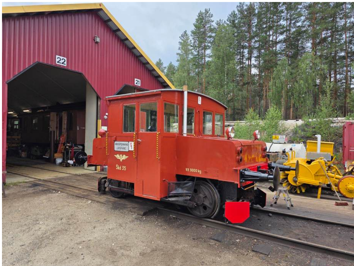
Skd 206.35 ferdig restaurert.

Skd 206.35: Traktoren ble ferdig restaurert i løpet av sommeren og var klar til bruk på stordriftsdagen. Traktoren har gjennomgått årskontroll. Det kan nevnes nye sjablonger og arbeid med veggfelt, medgått tid 42 timer.