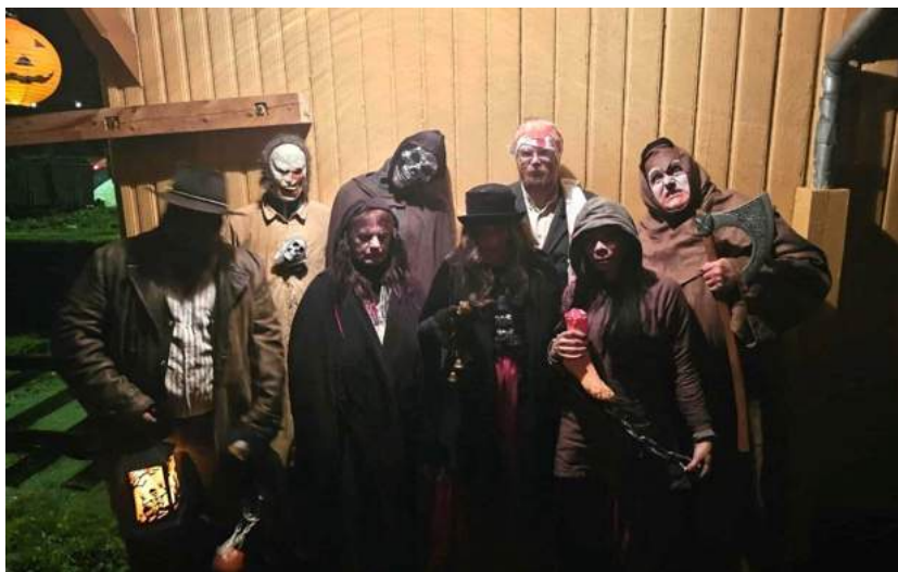
Denne gjengen fra Deadwood City var med og skapte skummel stemning både på Krøderen stasjon og ombord i spøkelsestogene lørdag 1. november.

Spøkelsestogene mellom Krøderen og Kløftfoss ble kjørt lørdag 1. november og dette viste seg nok en gang å være et populært arrangement. Det ble utsolgt denne gangen også, selv om det var en vogn ekstra på begge avgangene, sammenlignet med i fjor. Vi kunne telle til sammen 469 reisende på de to avgangene, noe som er ny rekord. 3 boggivogner og 2 toakslinger i tillegg til 2 skinnetraktorer ble benyttet