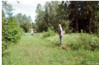
En anelse optimistisk å speide etter toget her – tidligere Kopstad stasjon