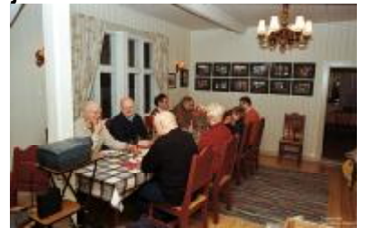
Gamle kjente i trivelig passiar