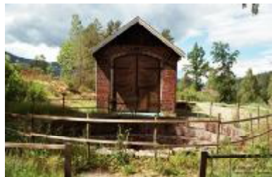
Pusserstallen og svingskive-graven på Eidsfoss