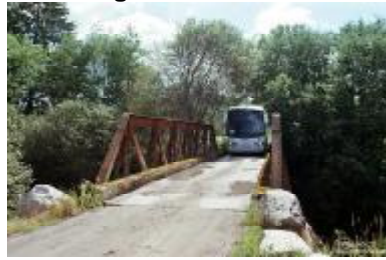
Freste bru passerer