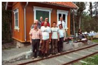
Familiebilde utenfor kopien av Ramnes stasjon som Museumsforeningen Vestfold Privatbaner har bygd i Hillestad