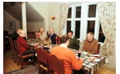
Det var mye og god mat ...