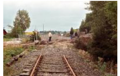
Mellom Sande mølle og Borre stasjon – Hortenslinjen har tapt for den nye veien