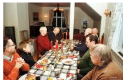
... og god stemning rundt bordet før kaffe og bildefremvisning