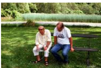
Ikke alle var like opptatt av maten ...