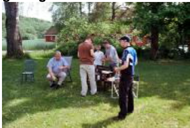
Grillmat smaker alltid om sommeren