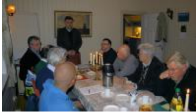
Velkomst til de fremmøtte