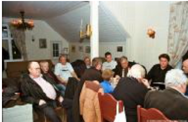
Godt fremmøte av nye og gamle medlemmer