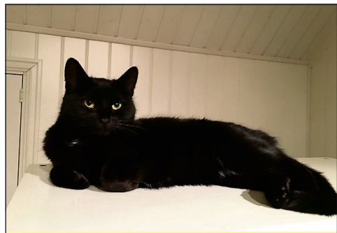
SETT DENNE?: Messi er en slank hunnkatt med hvite hår på mage og bryst.