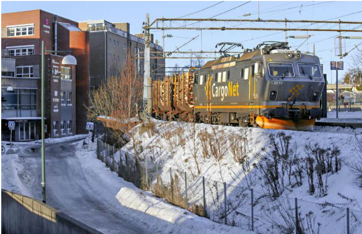
Et tømmer tog passerer Kolbotn 23.01.2024