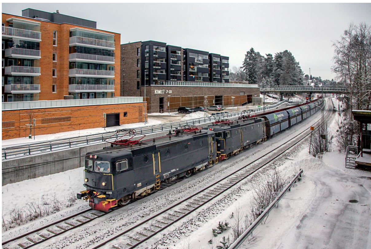
Tog 4453 Sarpsborg-Hove passerer den nye bebyggelsen på Myrvoll 12.01.2021. Rc3 1049 og 1058 trekker toget.