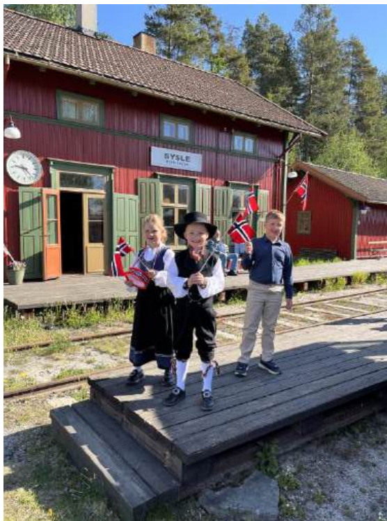
Forventningsfulle skoleelever klar til å gå om bord i 17. mai toget.

En lærer sa at elevene har gledet seg en hel uke på å ta toget. Etter turen var både foreldre og lærere veldig fornøyd med at Krøderbanen kunne stille opp på selveste 17. mai.