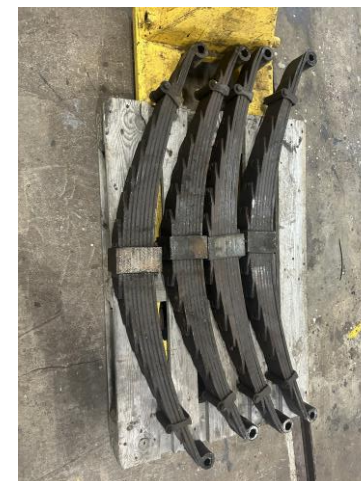
Konduktørvogn CF 3552 sine fjærer sendes til Sverige for vedlikehold

Fjærene er demontert og skal sendes verksted i Sverige for kontroll og utbedring. Her blir det sendt med reservefjærer som reservedeler i tilfelle skader. Vognkassen skal pusses og oljes utvendig.