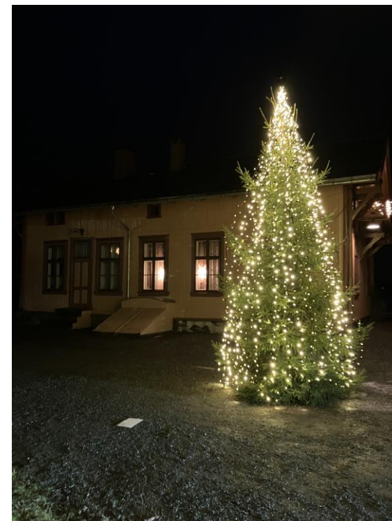
Årets juletre på Krøderen – et særdeles flott juletre

KrøderbaneNytt ønsker sine lesere god jul og et godt nyttår