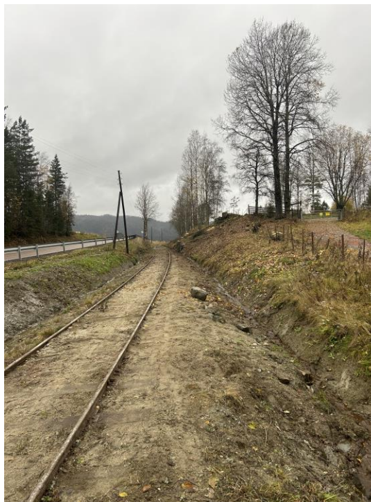
Legg merke til at det også ble rensset opp i grøften.

KrøderbaneNytt ønsker sine lesere god jul og et godt nyttår