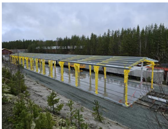
Magasinet er ca. 80 m. lagt og får 2 spor.