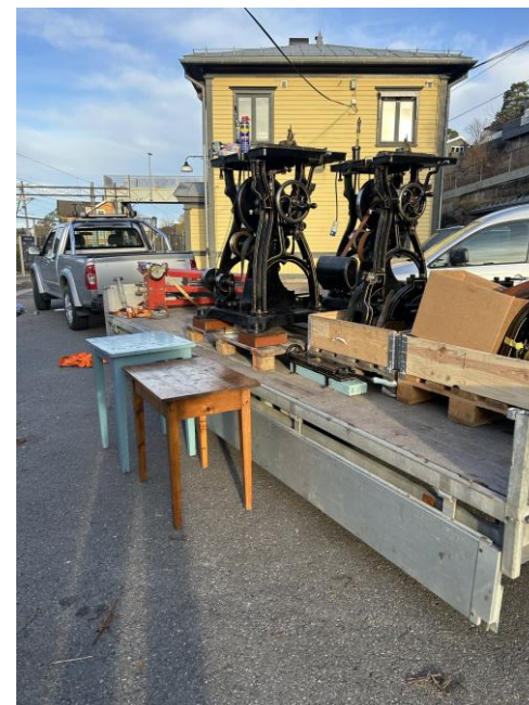
Tekst og foto: Henrik B. Backer

Billettrykkeriet på Nordstrand er demontert og flyttet til lager på Snarum. Årsaken er at Bane Nor trenger lokalene i bygget på Nordstrand selv. Før vi kan gjenoppta trykking av Edmondsonske billetter må ha nye lokaler. Det er foreslått å sette opp et bygg for dette bak stasjonsbygningen på Kløftefoss, kombinert med toaletter for de besøkende. Om vi skal satse på å flytte en gammel jernbanebygning eller bygge nytt er ikke besluttet ennå.