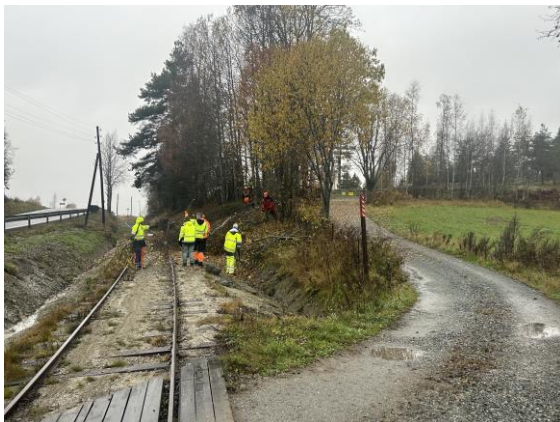
Ved Skytebaneveien, Snarum

Det nytter med vegetasjonsrydding. Bedre sikt for reisende med Krøderbanen og for trafikk på Skytebaneveien.