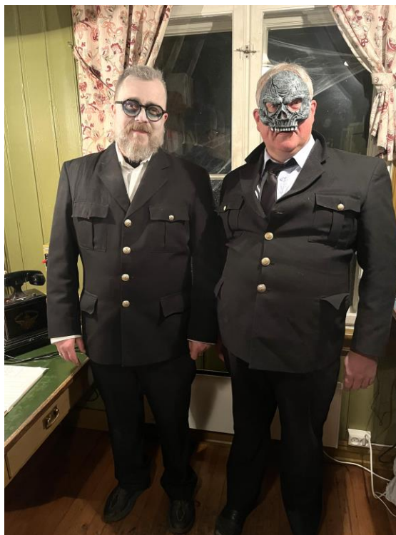
Foto: Skummel stasjonsbetjening på Krøderen

Enten du liker Halloween feiring eller ikke så har det kommet for å bli. Moro er det for unger i hvertfall. Krøderbanen kjørte i år for andre gang i historien hallowintog.