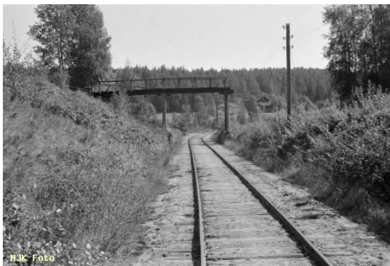
Området der det ble ryddet.

Ved ryddingen kom et steinsatt brukar bedre til syne. Skytterbaneveien gikk tidligere i bru over Krøderbanen.