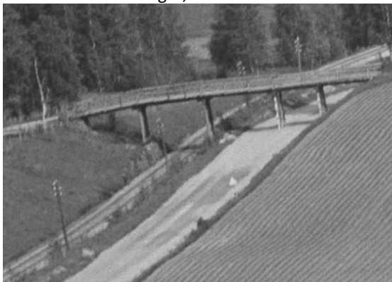
Oversiktsbilde fra 1953.