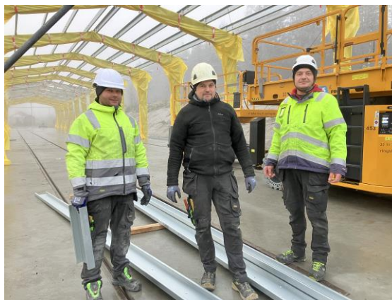
Mannskaper fra Borga Stålbygg AS

Et etterlengtet vogn- og lokomotivmagasin er under oppføring på Kløftefoss.