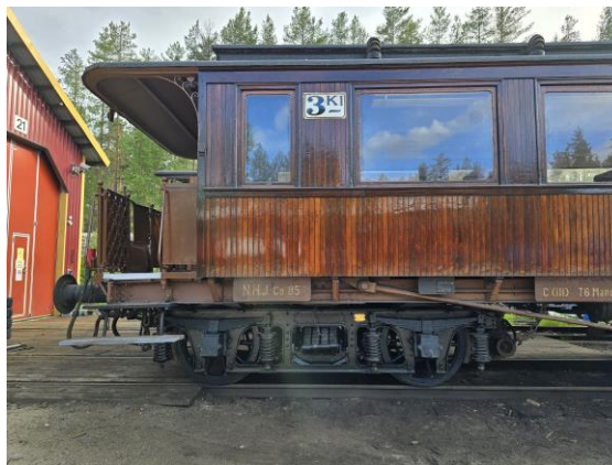
Nyreviderte boggiar og nypusset og oljet teakpanel på Co 85.

Søndag 16. juni var en stor milepæl nådd i arbeidet med boggirevisjonen på Co3b 85.