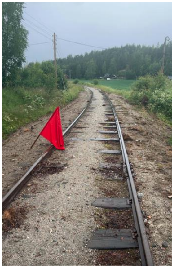
Stoppsignalet ble bevoktet forskriftsmessig for det toget som hadde stoppet på linjen.

Togbetjeningen fikk dermed prøve seg på bestemmelsene i sikkerhetsreglementets § 184 jamf. § 236. Her beskrives rutinene for tiltak når tog har stoppet på linjen på grunn av lokomotivskade eller annen årsak.