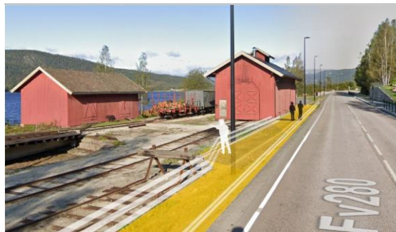
Det er sett på mulighetene for en opplevelsessti som begynner ved lokstallen og fortsetter videre til stasjonsparken og saga.

På Krødsherad festivalen som ble avholdt på stasjonsekra 22. juni viste Krødsherad kommune fram utkast til områdeplan for tettstedet Krøderen. Områdeplanen er en mulighetsskisse for hvordan en kan utvikle området.