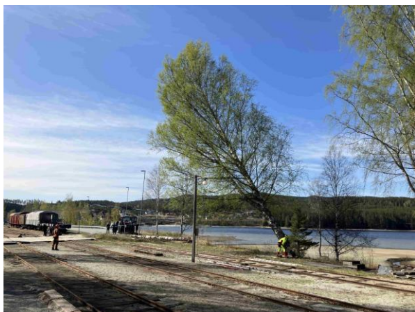
Det gamle bjørketreet har sett sine siste dager.

Krøderen velforening vil gjerne bidra til at det ser pent og ordentlig ut på Krøderen, og de tar i et tak der det trengs. Dette kommer også Krøderbanen til gode. Forrige året felte de ned alt buskaset nedenfor stasjonen slik at det nå er sjøutsikt langs hele stasjonsområdet.