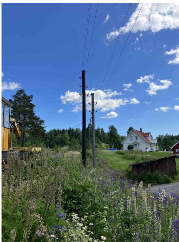
Ny stolpe til høyre ved Gubberud