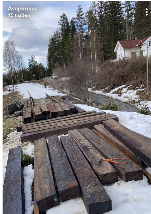
Vår nye banemester forbereder svilleskifte på bru ved km 110 mellom Morud og Gubberud