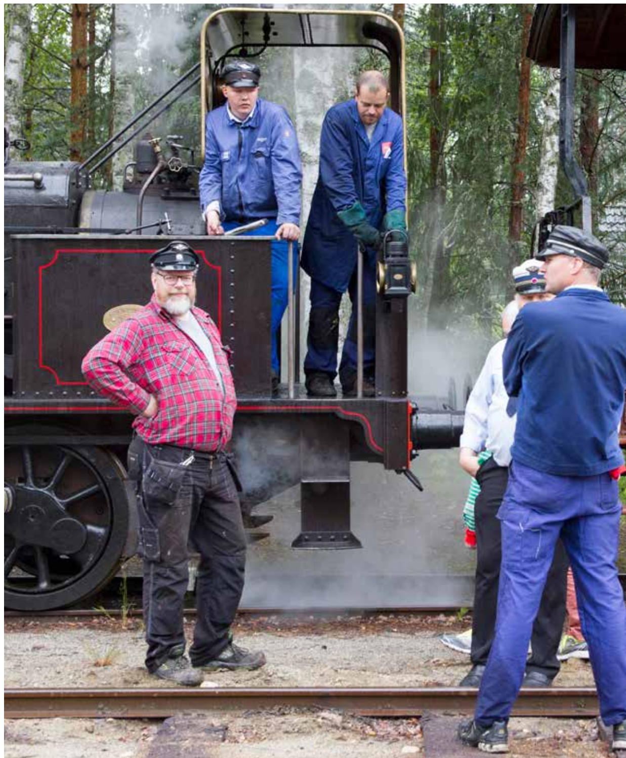
ALVOR: Ved Krødern i Buskerud går Krøderbanen som Stortinget vedtok allerede på 80-tallet at skulle bli museum. Hvis tilskuddet fra Bane NOR forsvinner, betyr dette at alle ansatte må sies opp og museumsavdelingen legges ned, skriver Buskerudmuseet i et brev til Bane NOR.

– Det er viktig at vi opprettholder sektoransvaret for kulturminnene, sier statsråd Ola Elvestuen (V).