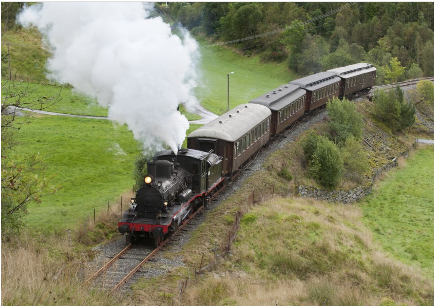
VAKKERT: Her er veteranetoget på Gamle Vossebanen ved Brattland.

Seinere i sommer vil det bli ulike feiringer for publikum på Gamle Vossebanen.