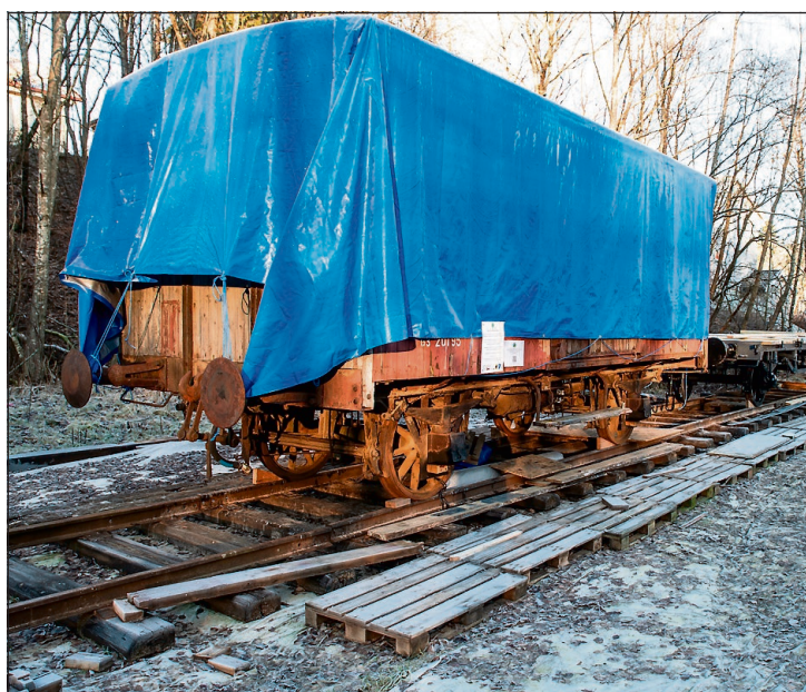
TILBAKE PÅ STRØMMEN: Denne G3-godsvogna ble bygget på Strømmens Værksted i 1922. Den blå duken vil ikke bli fjernet før til våren da oppussingen starter.