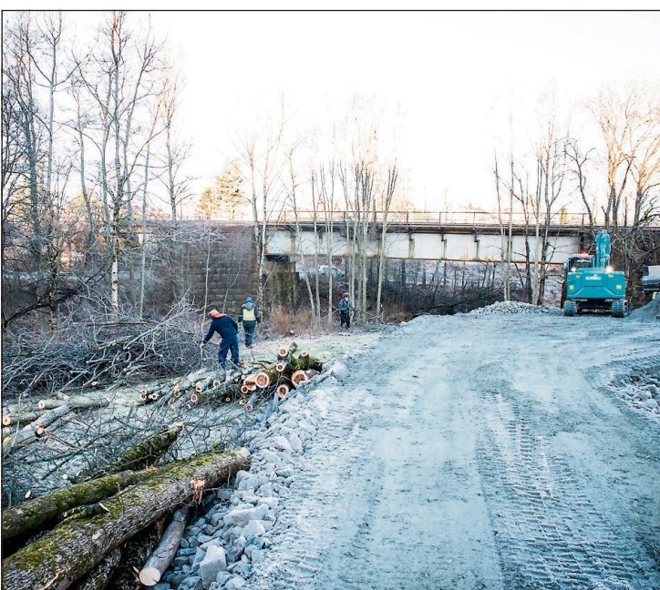
FELLER OG RYDDER: En del trær sto i veien for baneprosjektet og måtte fjernes. I bakgrunnen Hovedbanebrua i Sagdalen.