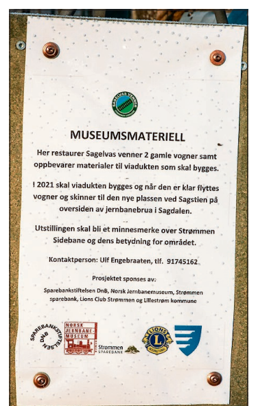
INFORMASJON: Sagelvas Venner legger alltid stor vekt på å gi god informasjon, så også i dette tilfellet.