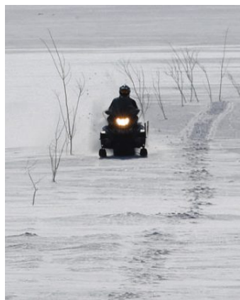
I dag er det bare hytteeiere som har en strekning på 2,5 kilometer eller mer fra brøytet bilvei til hytta, som får bruke snøscooter.

- De fleste reiser på hytta for å søke ro og fred, ikke for å utsettes for motorisert ferdsel. Økt snøscooterkjøring vil føre