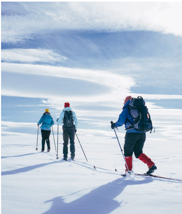
Norges Hytteforbund frykter nye snøscooter-regler vil skape uro og konflikter i hytteområdene.