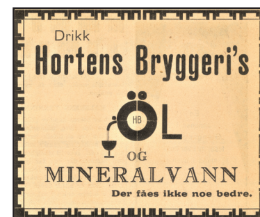
Gjengangeren 21. juni 1933.