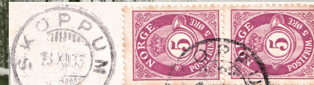
Stempel nr. 2 ble levert 19. november 1924 etter forti års kamp fikk poststedet og stampelet rett navn.

Vestre Sande var siste stoppested på Horten - Skoppumbanen før endestasjonen. Her var det siste mulighet til å kunne levere post til postvognen, eller få en tur til Skoppum.