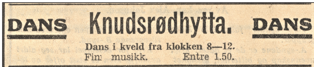
Gjengangeren 18. mars 1950.