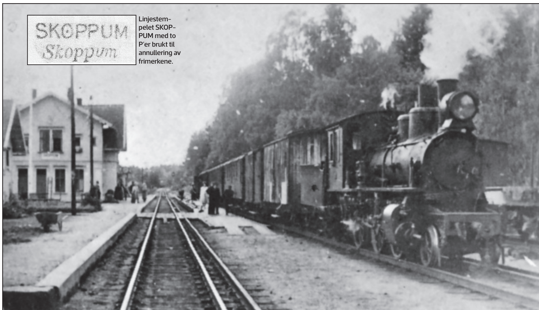
Linjestampelet SKOPPUM med to P'er brukt til annullering av frimerkene.